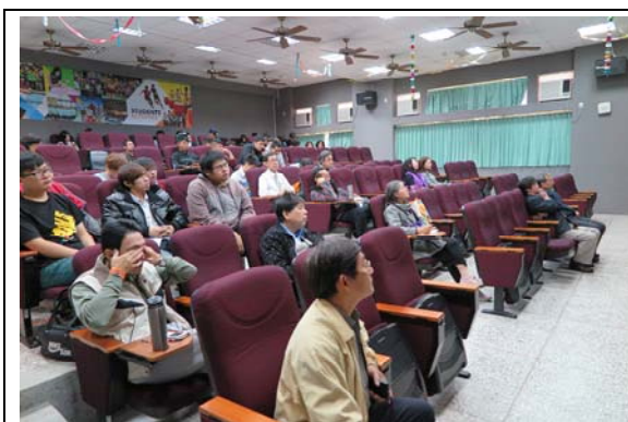
夥伴學校的教師對相關議題非常關注

邀請專家學者來介紹溫泉資源的正確使用與保護、溫泉資源如何融入生活當中、溫泉資源的永續使用與生活品質的提升，以地方礁溪溫泉為主，讓師生親身體驗溫泉之美。