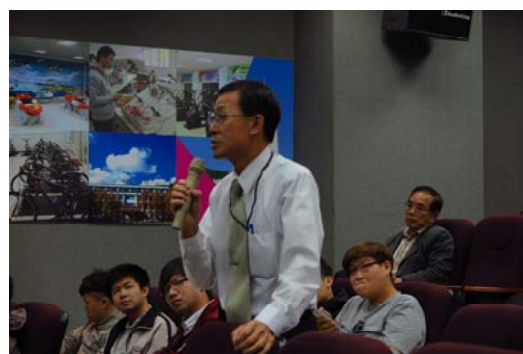
中華科大教師提問