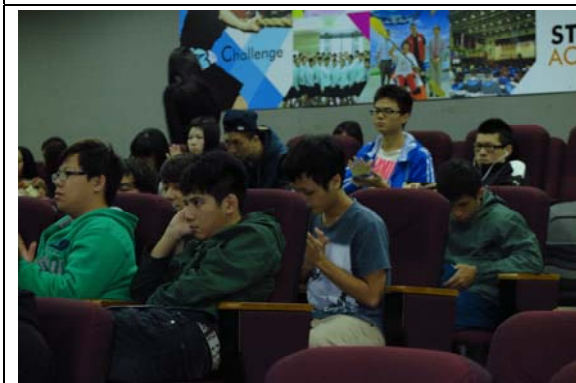
現場認真聽講的學生